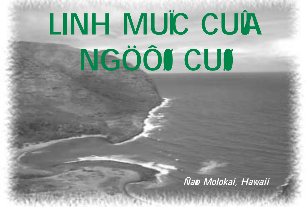
Ñã Molokai, Hawaii

T ôi nên thơ viết mỗi mấy cuốn sách cho hai ñia con. Trên kệ tình côi tôi thấy một cuốn phim mang tên MOLOKAI. Tôi mở cảm lên xem mỗi biết ñấy la cuốn phim nói về cha Damien, vị linh mục ñã cống hiến cái cuộc ñời cho người cui.