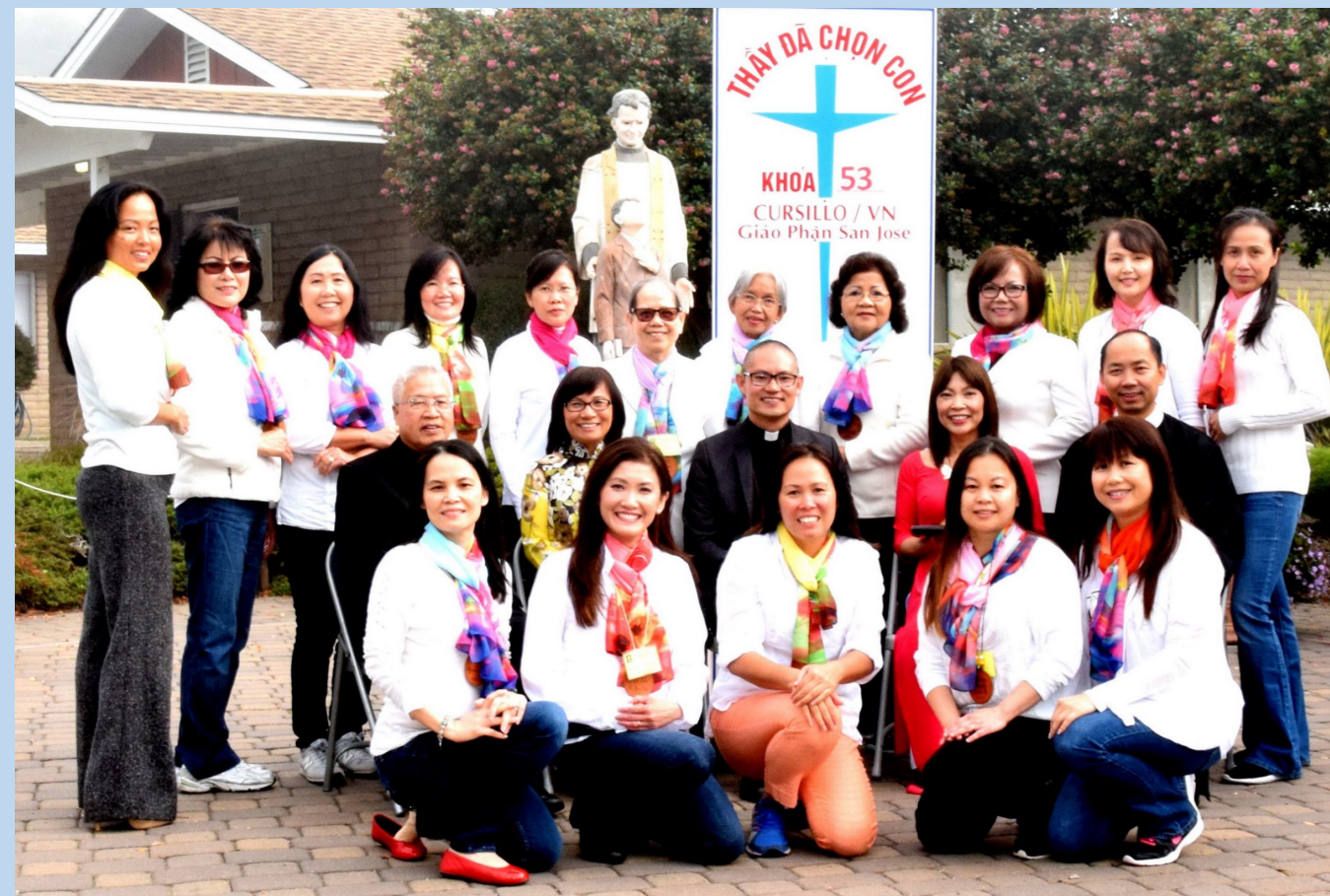
Khối Hành Chánh Khóa Cursillo Nữ 53