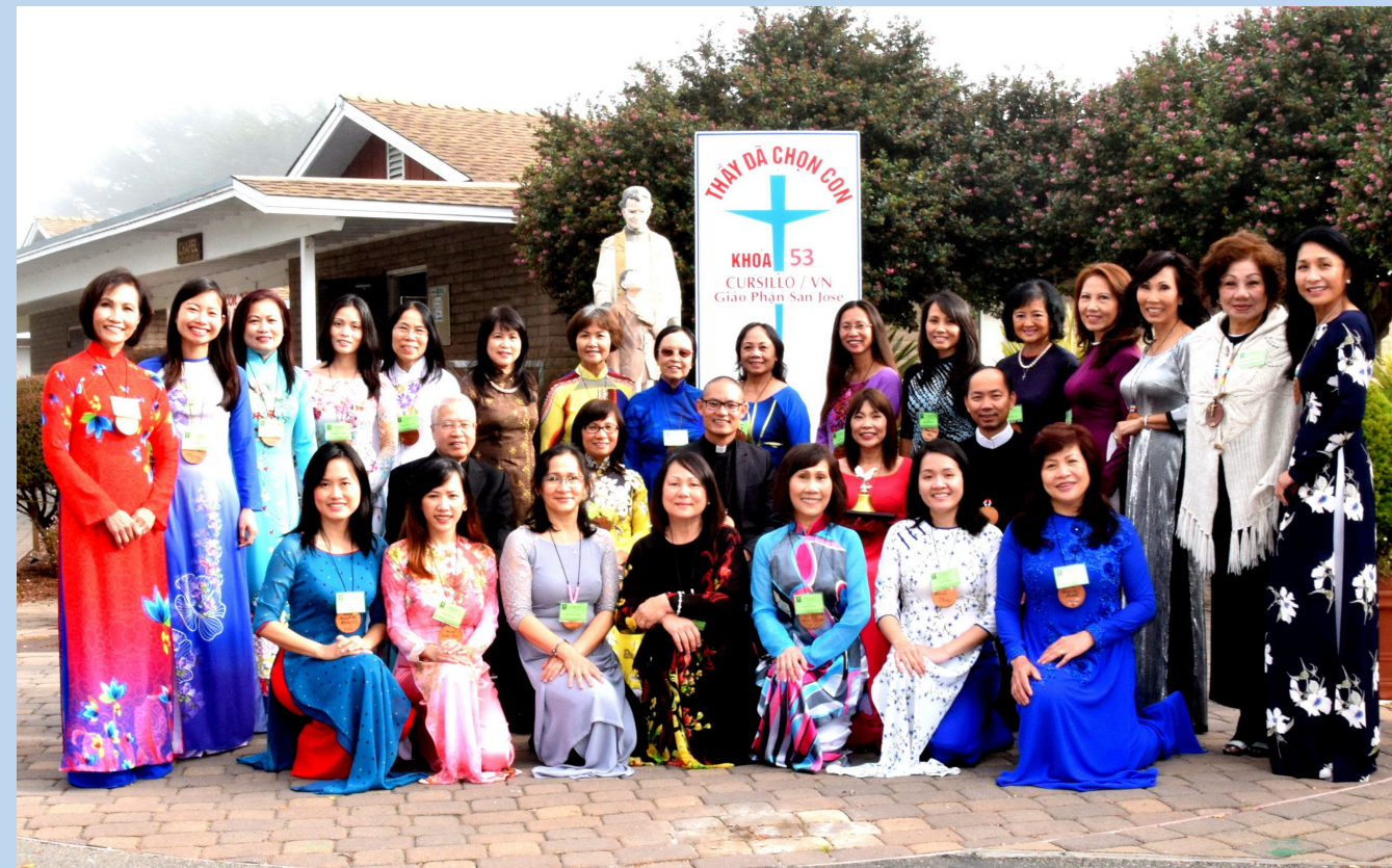
Khối Giám Học Khóa Cursillo Nữ 53