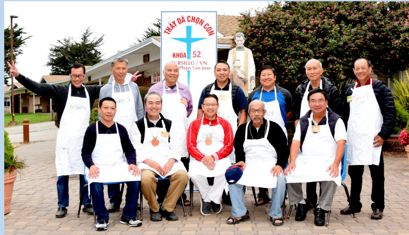
Khối Âm Thực Khóa Cursillo Nam 52