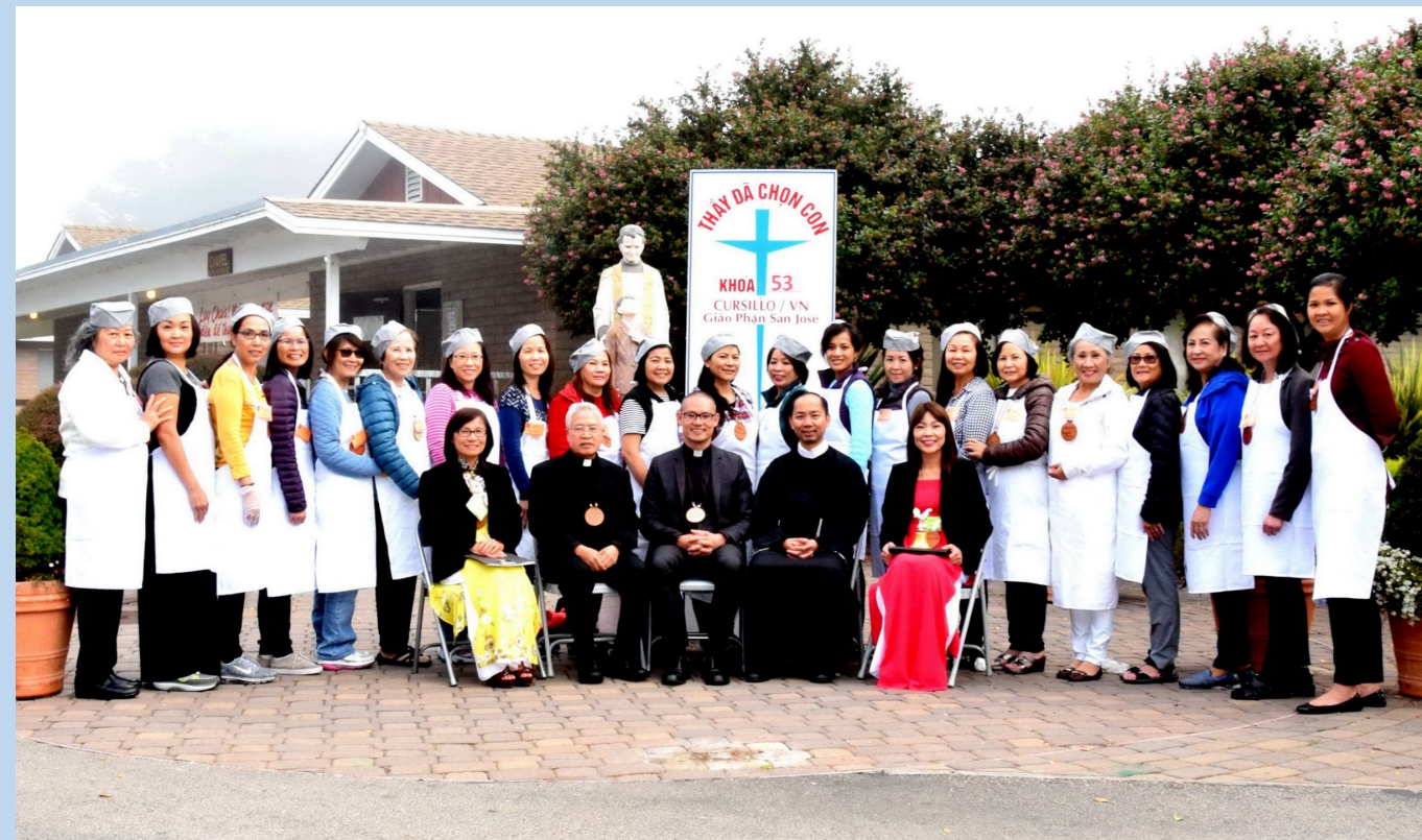
Khởi Ấm Thực Khóa Cursillo Nữ 53