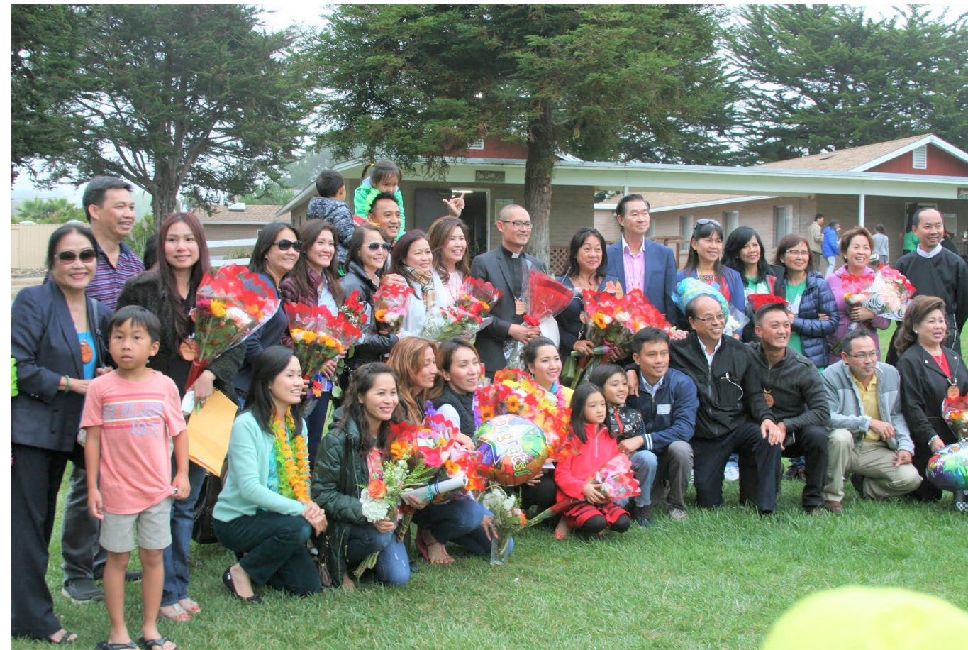
Bế mạc khóa Cursillo Nữ 53

O thương, chiều nay cuối khoá 3 ngày, cành hoa đặt trên mộ O, để nhớ lại ngày O dẫn vợ chồng đến trường, để nhớ lại O, nhớ lại Thầy Mẹ tôi đã dẫn tôi đi học.