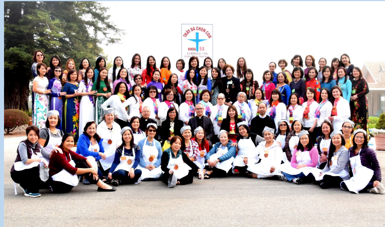
Trợ Tá Khóa Cursillo Nữ 53