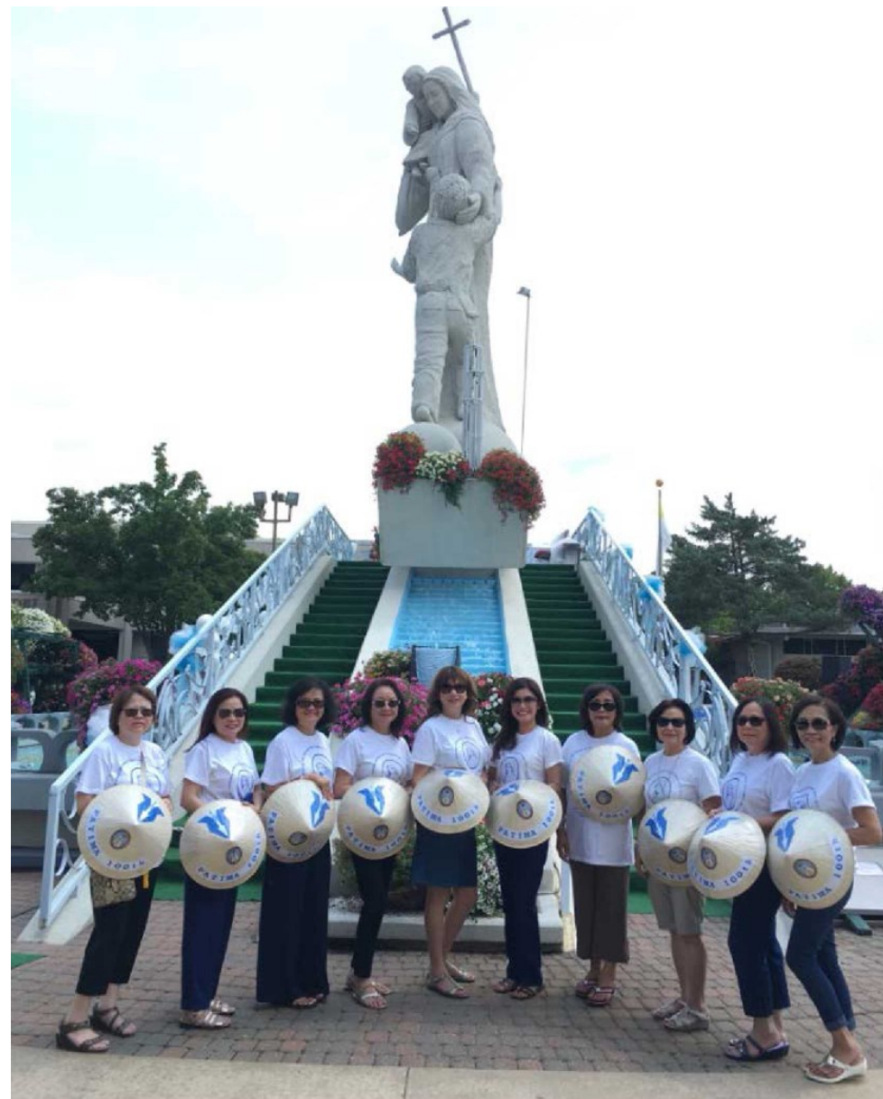
Kỷ Niệm Mùa Thánh Ân—Đại Hội Thánh Mẫu Lần 40, 2017, Missouri Hoa Kỳ

(Thay mặt nhóm hành hương, xin được viết tặng bạn đọc trong tâm tình cảm tạ bao hồng ân Chúa ban qua lời cầu bầu của Đức Mẹ Maria và xin được nguyện mãi luôn sống tri ân...)