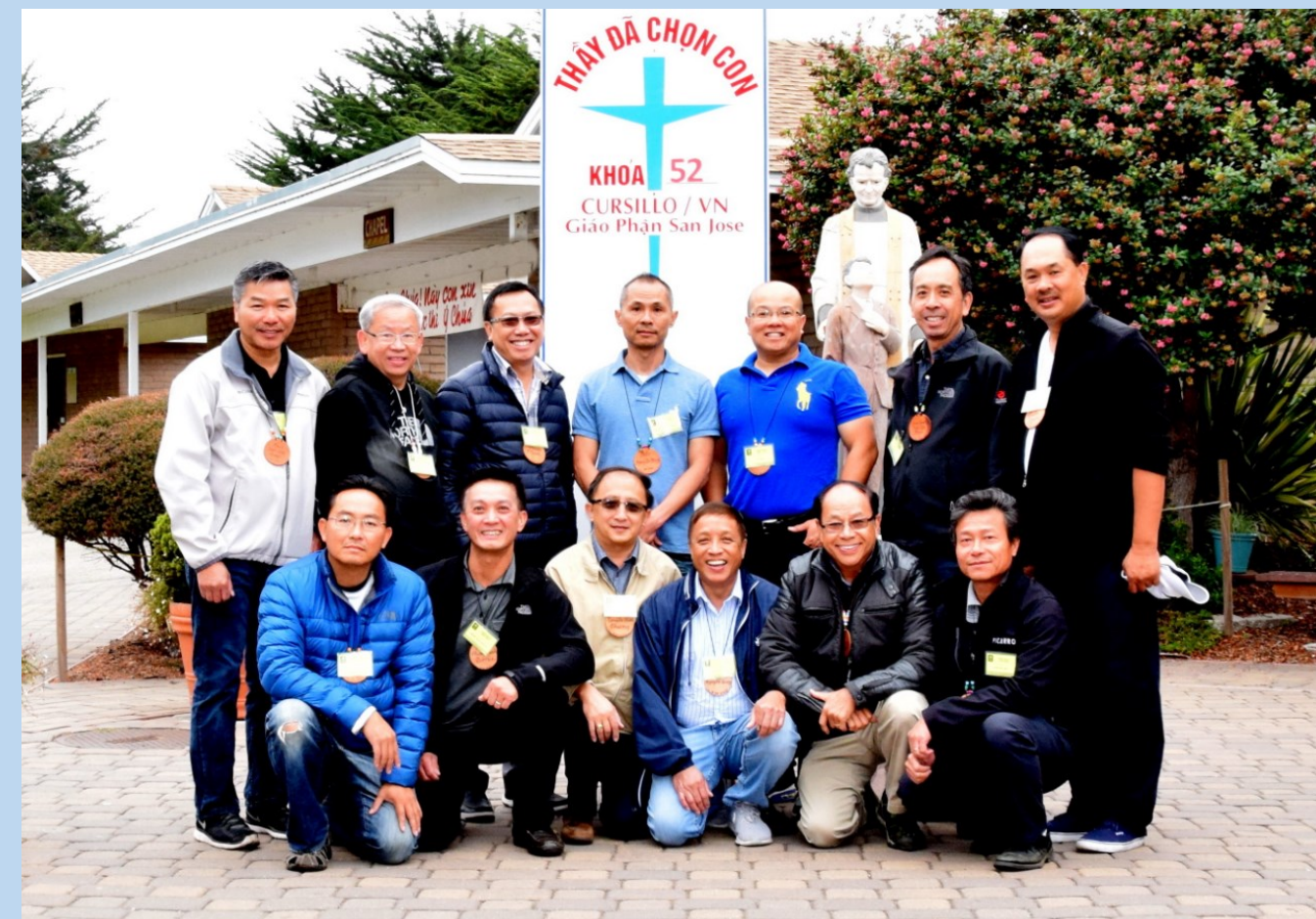
Khối Hành Chánh Khóa Cursillo Nam 52