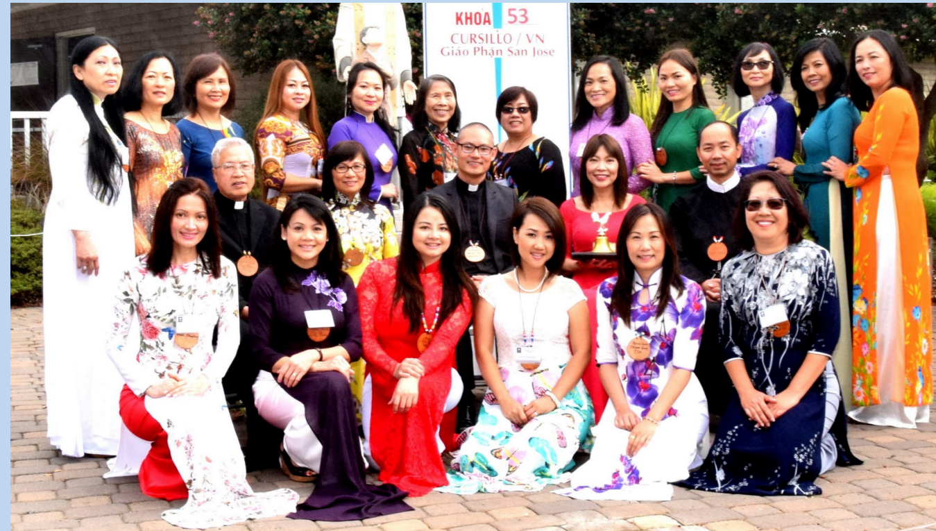
Khối Phụng Vụ Khóa Cursillo Nữ 53