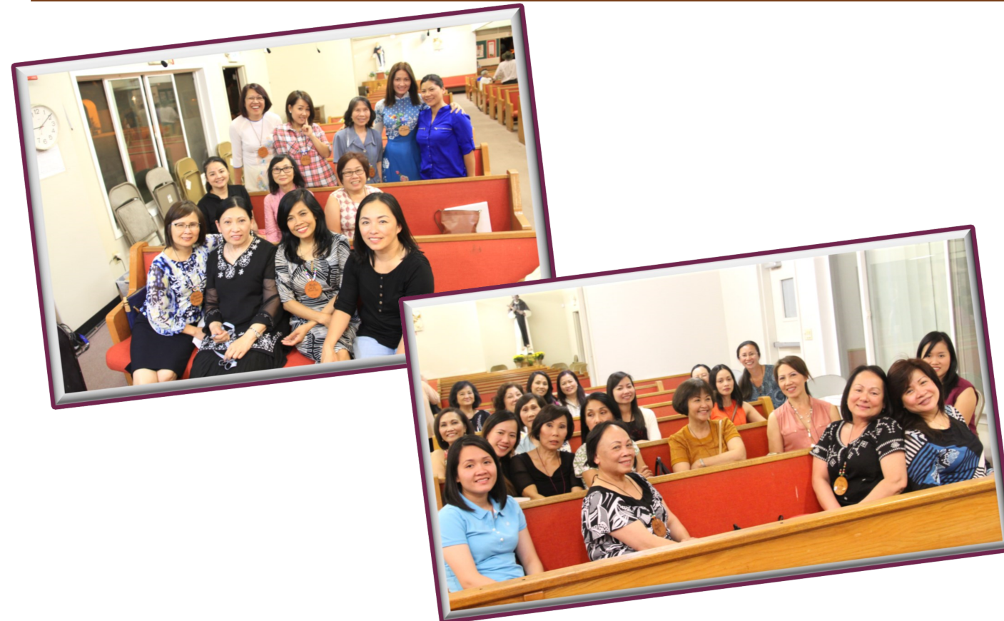
Hình ảnh 8 Tuần Tĩnh Huấn, 2017

T/b:(*) Chúng tôi họp Nhóm trong cánh gà nhà thờ Our Lady of Peace hoặc tại sân cỏ dưới chân Mẹ. Bài này được viết sau khi các Chị cùng Decuria đã đọc và cho phép gửi đến tờ UL-TREYA của Phong Trào.