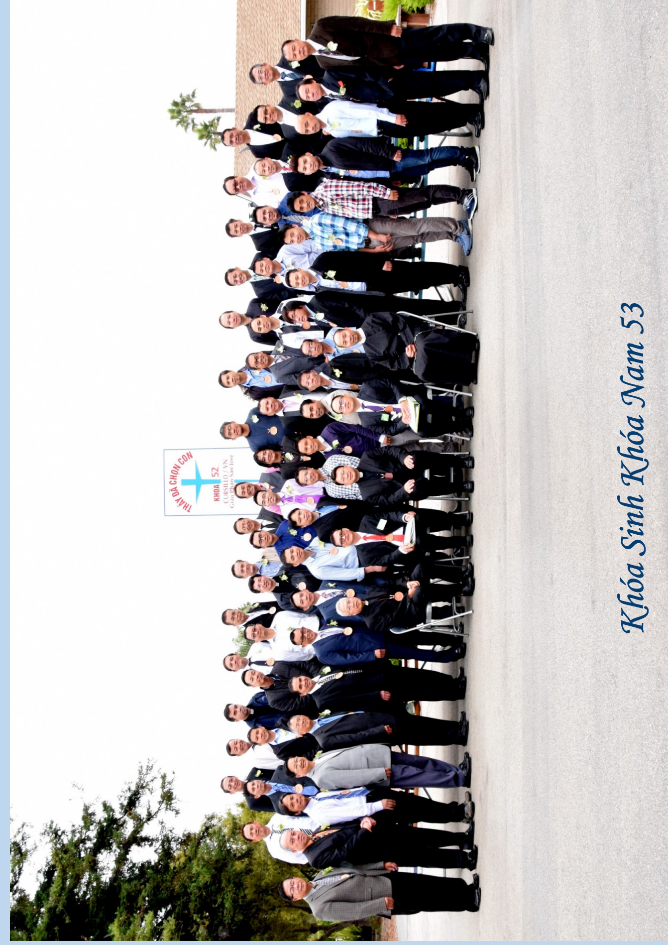
Khóa Sinh Khóa Nam 53