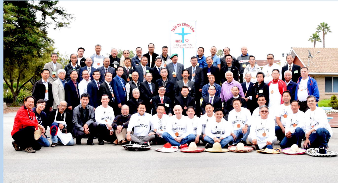
Trợ Tá Khóa Cursillo Nam 52