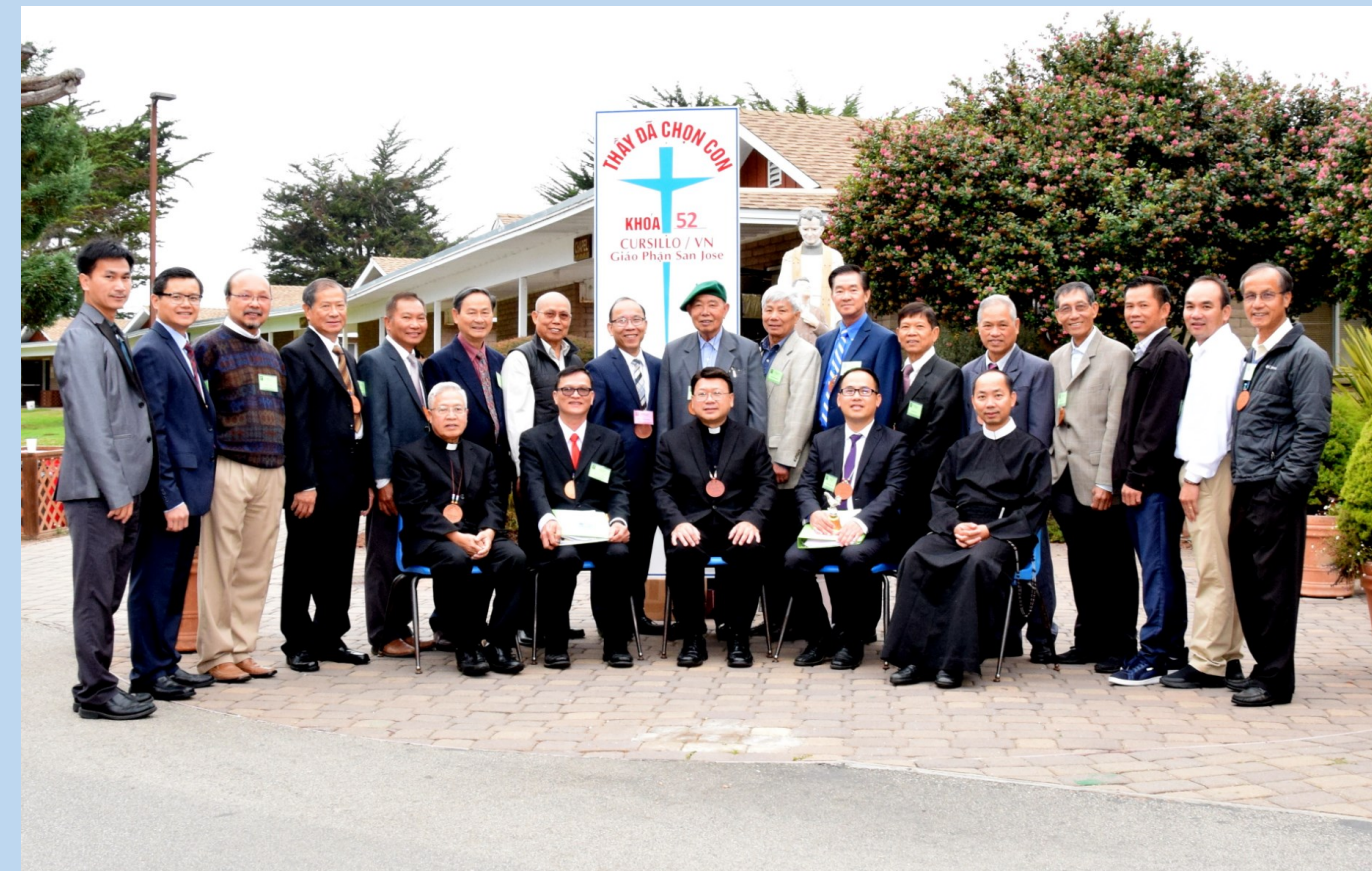
Khối Giám Học Khóa Cursillo Nam 52