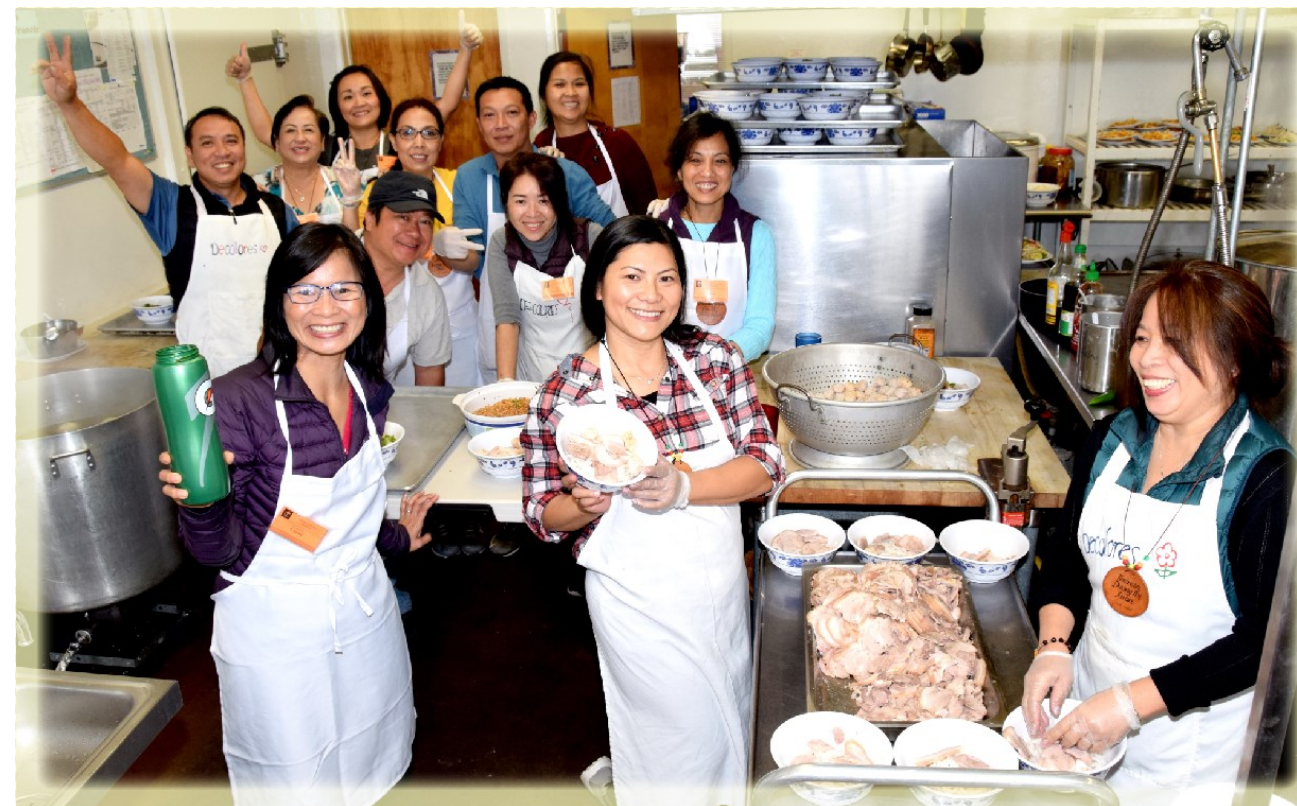
Khối Âm Thực Khóa Nữ 53

... Màu vàng màu của kiêu sa Màu vàng màu của tình ta tuyệt vời... (Màu Vàng)