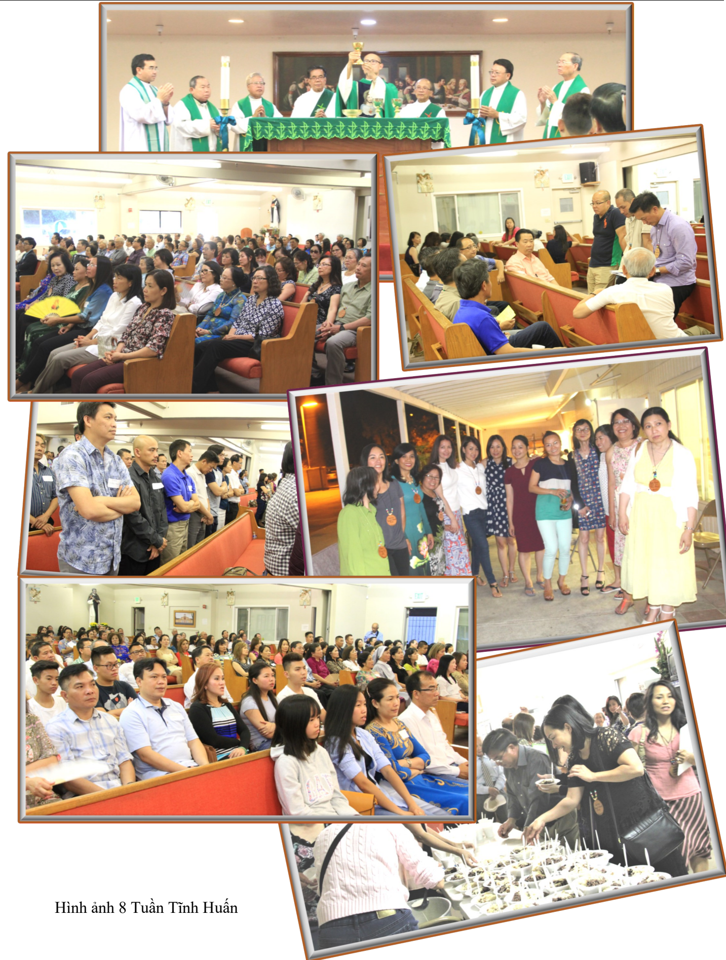
Hình ảnh 8 Tuần Tĩnh Huấn