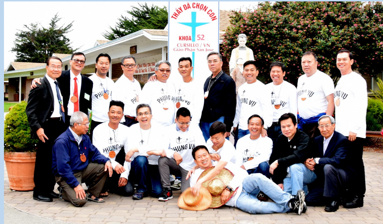
Khối Phụng Vụ Khóa Cursillo Nam 52