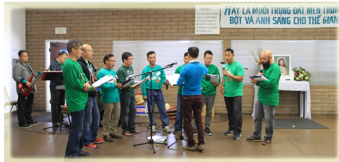
Khởi Phục Vụ Khóa 52

Tôi cũng cảm ơn Chúa vì Ngài đã ban cho tôi sức khỏe, thời gian và cơ hội tham dự trợ tá năm nay để tôi cảm nghiệm sâu xa hơn về tình người, về ý nghĩa của những công việc mà mọi người đã làm vì yêu mến phục vụ và nhất là được cùng anh em thân thương ca ngợi và tôn vinh Thiên Chúa là Cha Yêu Thương của chúng ta.