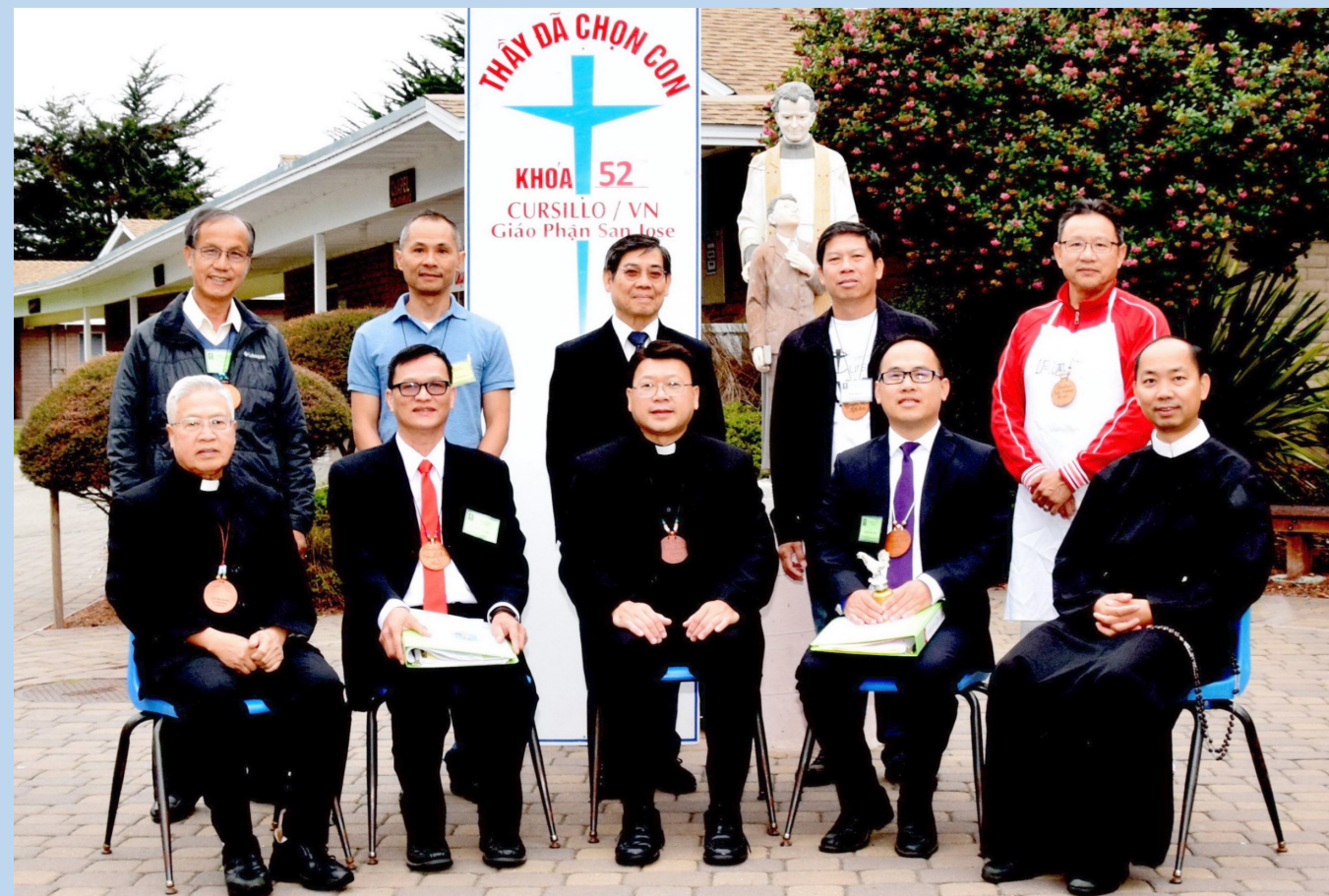
Trưởng Khối Khóa Cursillo Nam 52