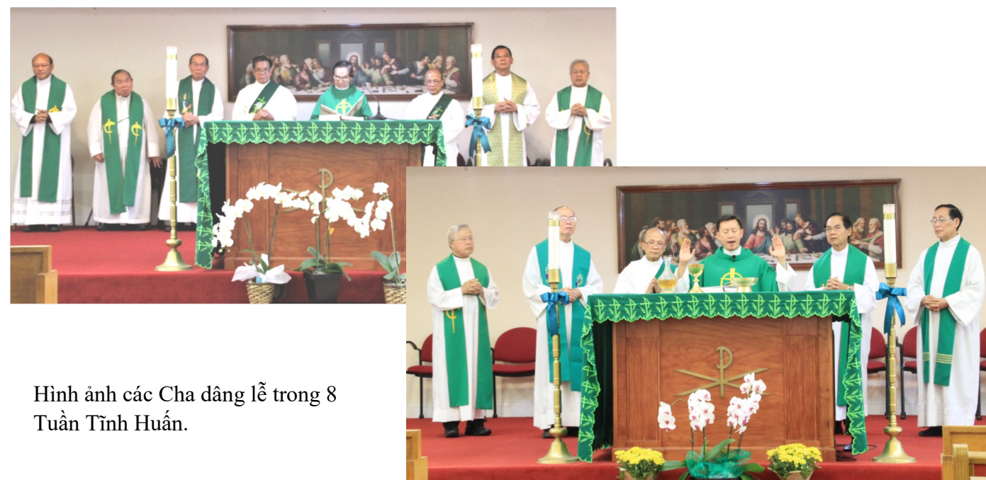
Hình ảnh các Cha dâng lễ trong 8 Tuần Tĩnh Huấn.

3. Sau hết, ai đi hành hương cũng mong muốn và cầu xin những ơn lành hồn xác cho bản thân, gia đình, họ hàng hay những người xin cầu nguyện. Điều chắc chắn là ai cũng được ơn riêng ít nhất là sự bằng an trong tâm hồn, hay là đã được đến tận nơi Mẹ hiện ra để được trực tiếp xin ơn và tạ ơn Mẹ Ban. Riêng gia đình con đã được Mẹ nhân lời. Xin tri ân và xin ca tụng danh Mẹ đến muôn muôn đời.