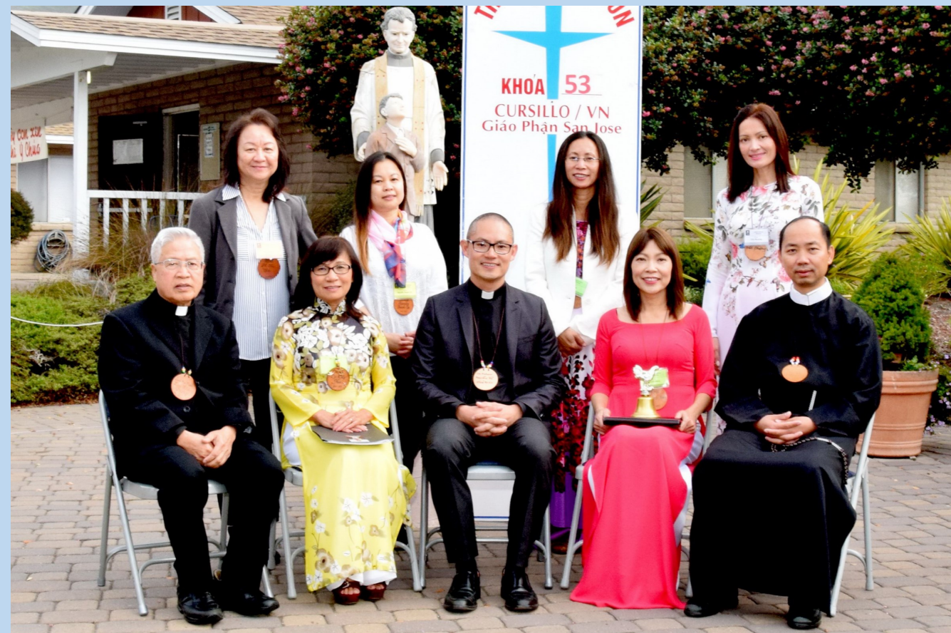
Trưởng Khối Khóa Cursillo Nữ 53