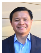
KHỐI TRUYỀN THÔNG