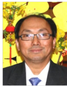
TRƯỜNG LÃNH ĐẠO