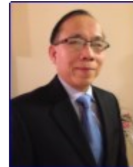
PHÓ CHỦ TỊCH PT