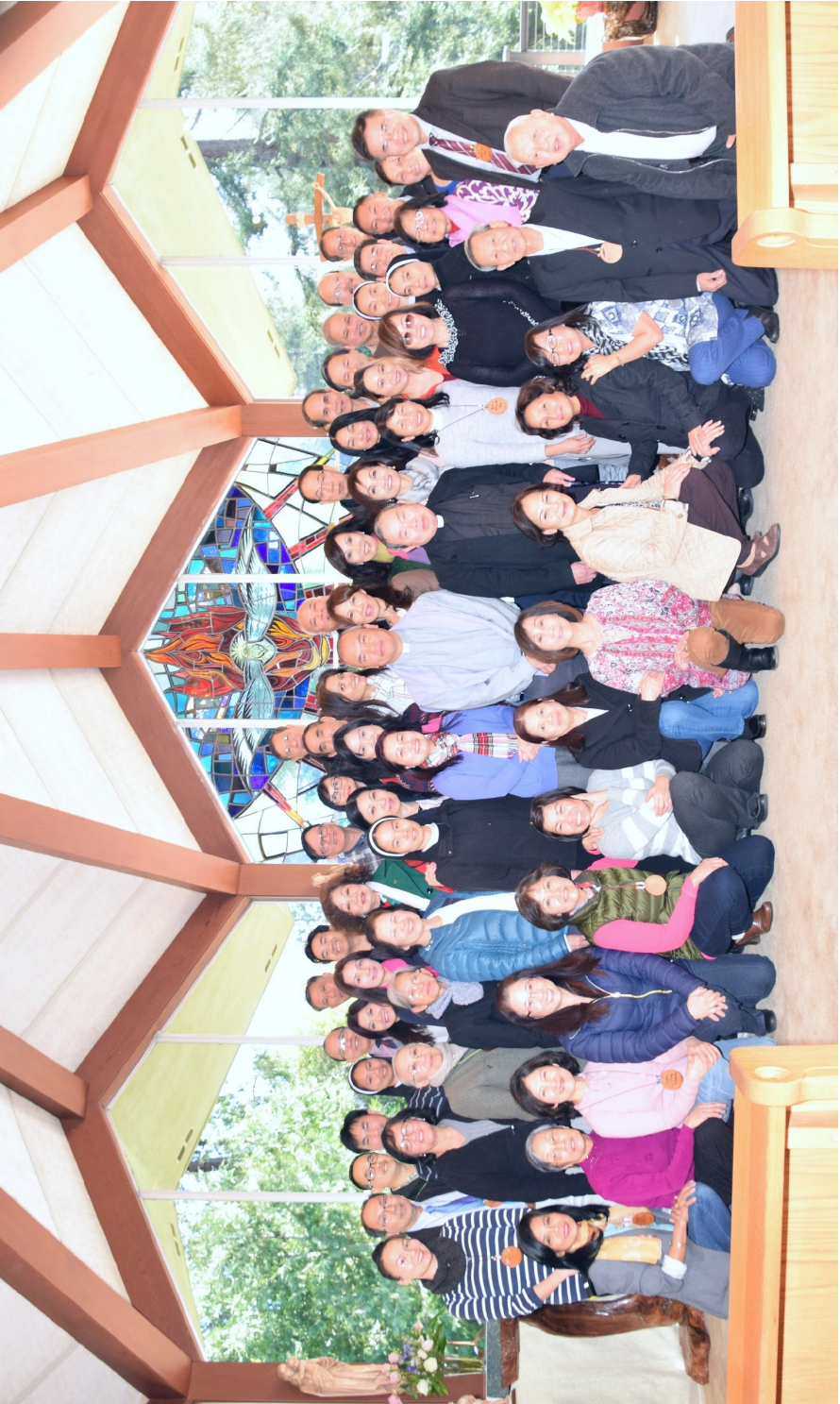
Hình Các Tham Dự Viên Khóa Tĩnh Tâm Của Phong Trào Cursillo VSJ tại St Clare's Retreat Center, 13—15/01/2017