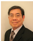
KHỐI BA NGÀY