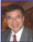
CHỦ TỊCH PHONG TRÀO